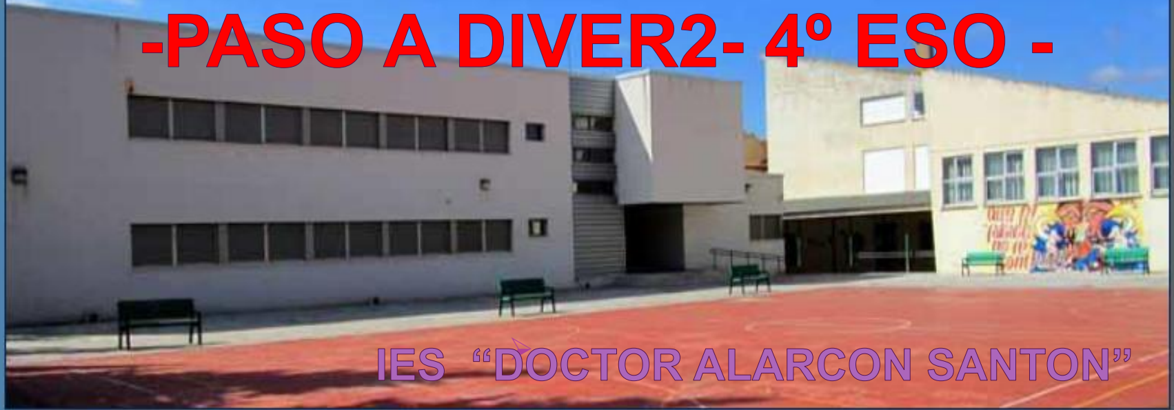
IES "DOCTOR ALARCON SANTON"