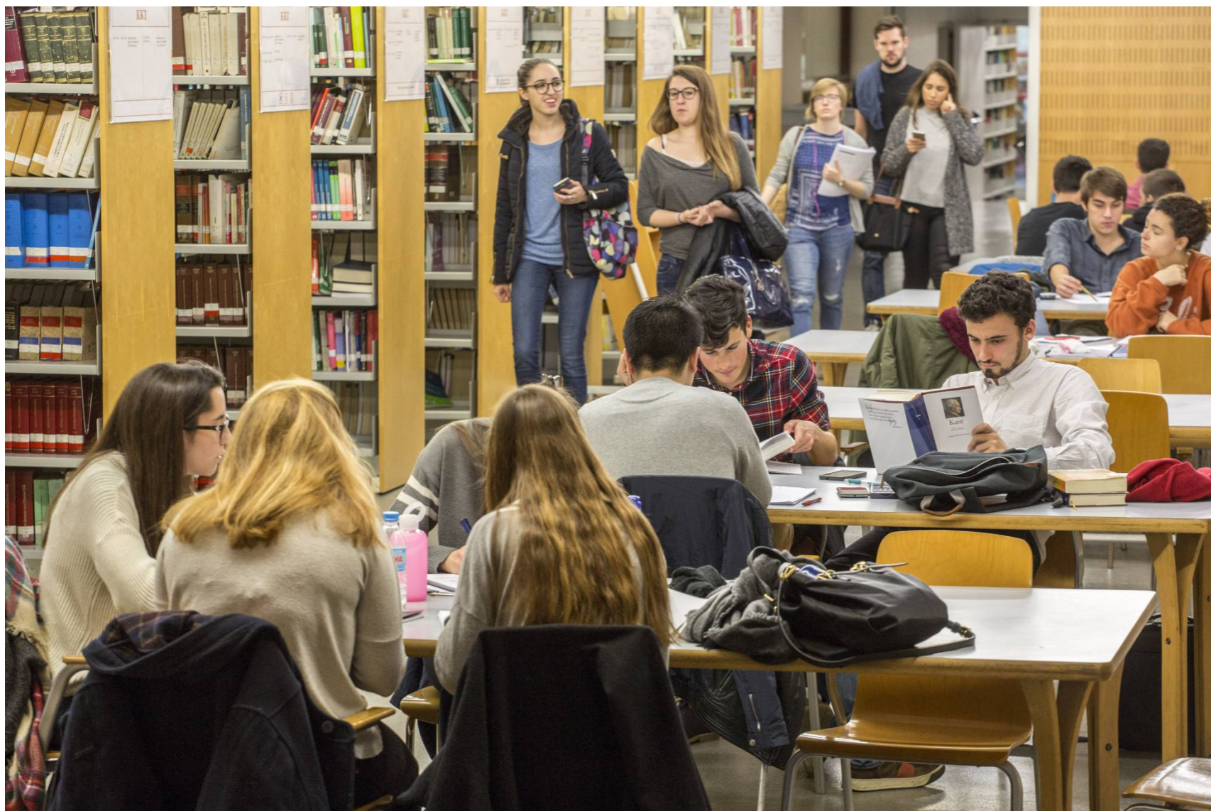
Ranking de universidades en España: Instalaciones de la Universidad Pompeu Fabra, el pasado marzo. CARLES RIBAS

Cinco campus catalanes están entre los 20 con mejores resultados generales de la tercera edición del ranking de la Fundación Conocimiento y Desarrollo (CyD) . Y tres de ellas, todas públicas, en los primeros puestos: Pompeu Fabra, Autónoma de Barcelona y Barcelona. Las catalanas salen mejor en esta clasificación, presentada este lunes, siguiendo la tendencia de otros trabajos publicados recientemente, como la de la Fundación BBVA o el ranking europeo U- Multirank.