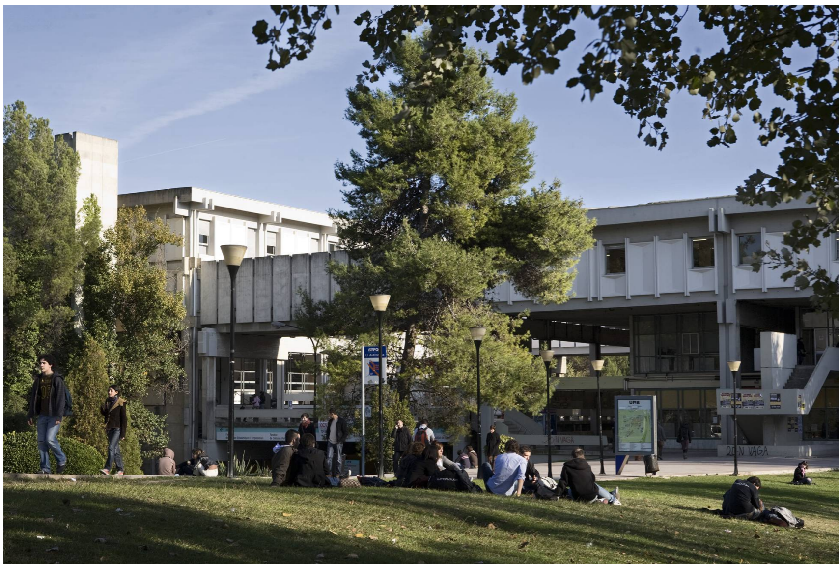
El campus de la Universidad Autónoma de Barcelona (UAB).

El sistema catalán de universidades vuelve a destacar como el mejor de España . Seis de los 10 con mejor rendimiento están en Cataluña, según la clasificación que presenta este miércoles la Fundación CyD (Conocimiento y Desarrollo). En los primeros cinco puestos globales están la Autónoma de Barcelona, la Universidad de Navarra, la catalana Pompeu Fabra, Carlos III de Madrid y la Universidad Girona.