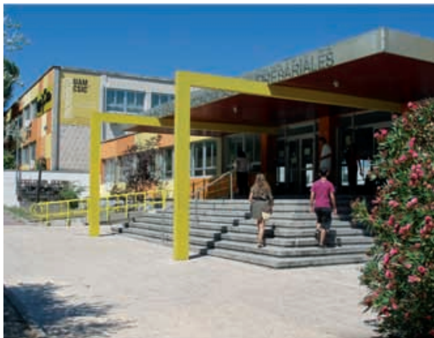
Imagen de la Facultad de Ciencias Económicas y Empresariales de la Universidad Autónoma de Madrid.

mente difícil salir y para la que se precisan de reformas y actuaciones concretas e importantes, es más que nunca necesario que haya en el futuro especialistas y buenos gestores en el sector financiero y en la economía en general.