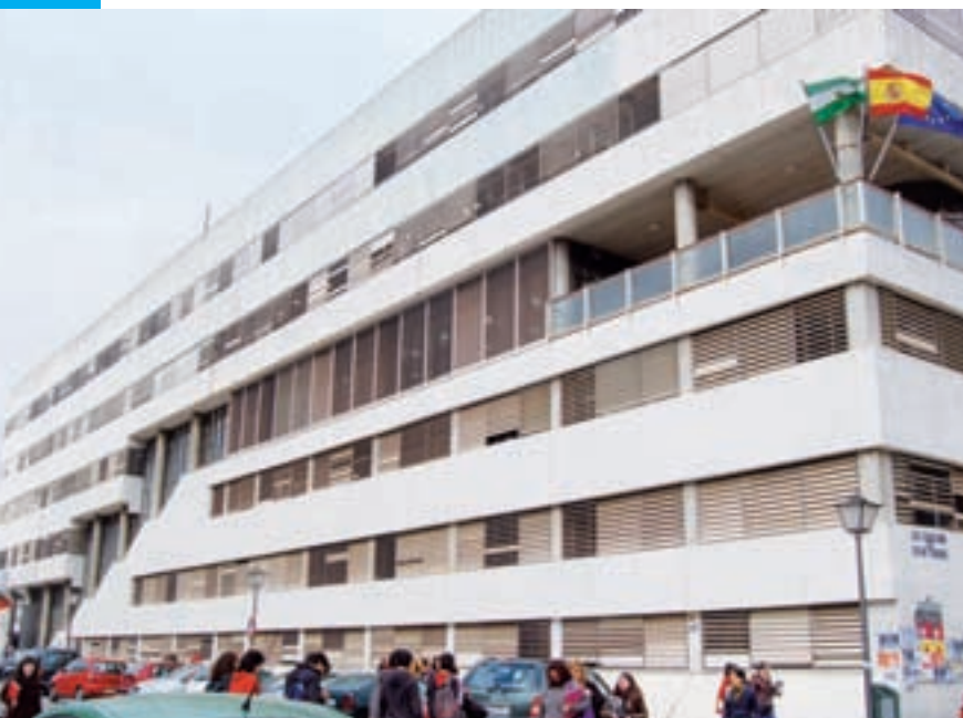
Imagen de la Facultad de Farmacia de la Universidad de Sevilla.