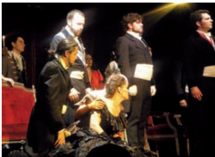
En la ópera, la dramatización viene a ser, junto con el elemento musical, lo más importante. En la imagen, La Traviata , en el centro cultural Moncloa, de Madrid.

Una vez superado el Grado Superior de cuatro años, el cantante lírico puede emprender una carrera como solista, así como la posibilidad de cantar en grupos de cámara o en coros profesionales. Asimismo, puede dedicarse a la docencia o, si lo prefiere y se ve capacitado,