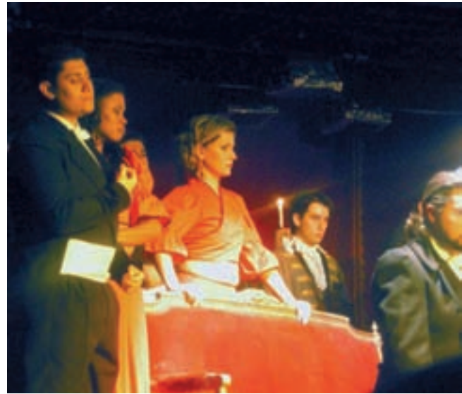
Los alumnos que están iniciando el grado superior tienen la posibilidad de formar parte del coro en los montajes escénicos.

plejo y de dificultosa reparación. Por ello, entre estos hábitos saludables cabría citar un descanso adecuado (mínimo 8 horas de sueño), no elevar el tono de voz en ambientes ruidosos, no abusar de las bebidas frías, entre otros. Claro está, nunca hay que obsesionarse con estos cuidados, procurando llevar una vida lo más normal posible.