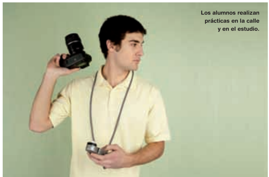
Los alumnos realizan prácticas en la calle y en el estudio.

expansión. La importancia de las creaciones gráficas se debe a que se emplean en todos los sectores y son útiles en una sociedad completamente atraída por las producciones gráfico-visuales. ✖