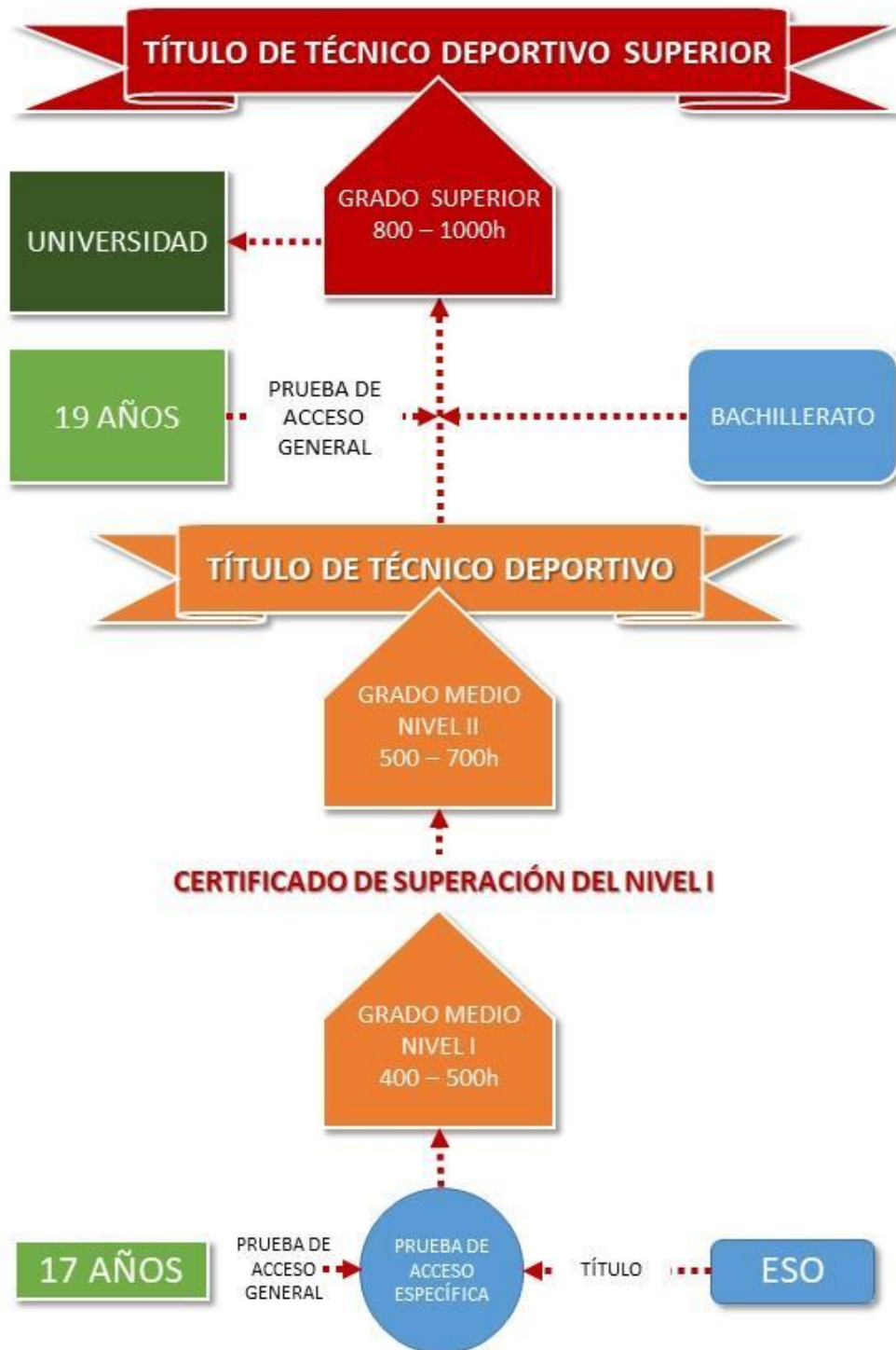
Ilustración 3 EDRE