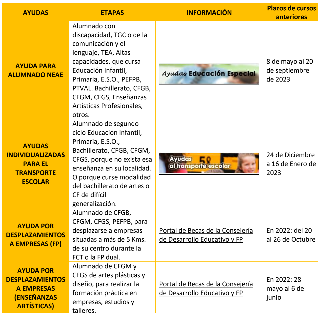
Tabla 27 Ayudas al estudio