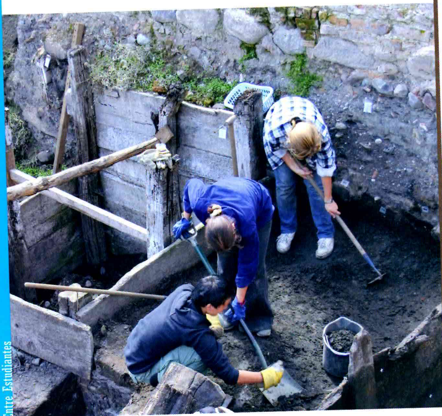
Entre Estudiantes 24

Aunque el atractivo de esta carrera no es precisamente el de abrir las puertas de un gran mercado laboral, no hay que olvidar que el mundo de la cultura se ha convertido en una actividad económica cada vez más importante. En todo caso, estamos ante una carrera con un fuerte componente vocacional y casi todos los alumnos que se adentran en este interesante Grado son unos enamorados de las diversas manifestaciones de la Historia. ✧