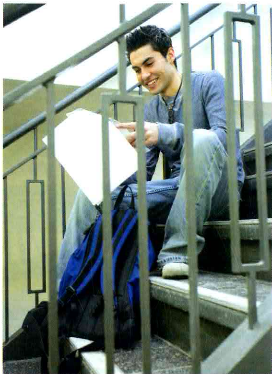
El grado está formado por cuatro cursos académicos.